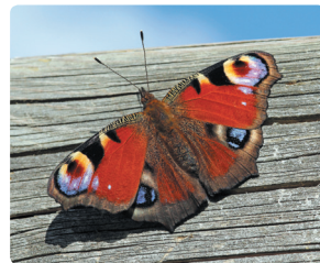
Метелик павичеве око